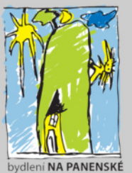
bydlení NA PANENSKÉ